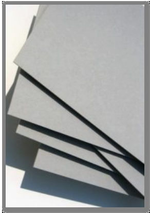
Graupappe 1,5 - 6,0 mm