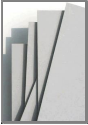
Graukarton 0,5 - 1,0 mm